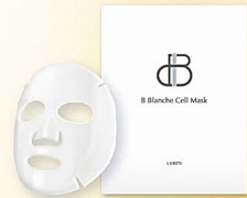
B Blanche Cell Mask

(ATTENTION) こちらの商品にはポイントつきません。またコンベンション当日のお受け取り商品のため、配送は行っておりません。